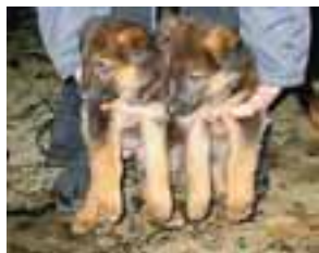
Schaferhvolpar (2 hundar, 2 tikur) með ættbók frá HRFI til sölu. Uppl. í s. 869 6888.