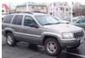
Cherokee Grand Limited '99. Ek. 95 þ. Áhv. 2 millj. Tilboð 2.6 millj. S. 845 3705.