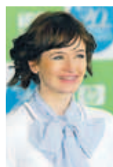
EMILY MORTIMER leikkona er 37 ára.