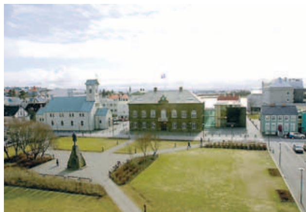
Menntaviti verður reistur á Austurvelli í dag til að vekja athygli á mikilvægi menntunar og högum námsmanna.

Við þetta sama tækifæri skrifuðu fulltrúar Orkuveitu Reykjavíkur og KVENN undir samstarfssamning um að veita árlega slíkar viðurkenningar og halda sýningar á íslenskum uppfinningum. Það er gert til eflingar og nýsköpunar í íslensku atvinnulífi.